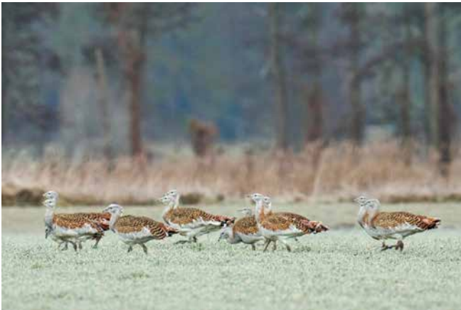
Großtrappen Belziger Landschaftswiesen.

Auf einem der fünf Demonstrationsbetriebe des Modellprojekts Naturschutzberatung Brandenburg werden Maßnahmen zum Schutz der seltenen Großtrappe durchgeführt. Ende August stellte der Betrieb NaturKonkret Guido Leutenegger Planetal-Lütte GmbH – Großtrappenhof verschiedene Möglichkeiten vor, das Grünland so extensiv zu nutzen, dass neben der Großtrappe auch weitere, inzwischen sehr selten gewordene