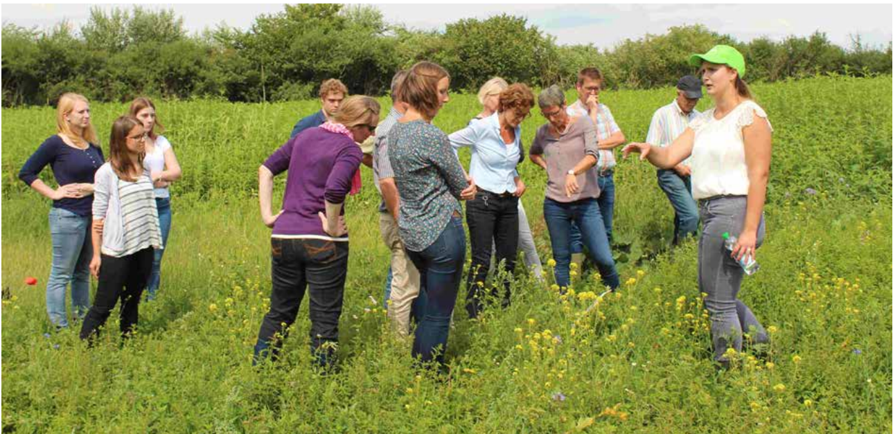
Das Sammeln von praktischen Erfahrungen und der gegenseitige Austausch stehen auf den Leitbetrieben Biodiversität in NRW im Fokus.

Im Zuge der Rahmenvereinbarung zwischen den beiden Landwirtschaftsverbänden, der Landwirtschaftskammer NRW und dem NRW Landwirtschaftsministerium betreut das Team Biodiversität seit 2016 landwirtschaftliche Betriebe, auf denen eine möglichst große Vielfalt an Natur- und Artenschutzmaßnahmen beispielhaft und für die jeweilige Region exemplarisch umgesetzt werden. Insgesamt bilden 14 Betriebe ein Netzwerk, das nahezu alle in NRW vertretenen Landschaftsräume und Produktionsrichtungen abdeckt und damit die betriebliche Vielfalt der nordrhein-westfälischen Landwirtschaft widerspiegelt. Bisher koordinierte und betreute eine einzelne Person zentral die Leitbetriebe. Ein Personalwechsel im Juli brachte die Chance, die Betreuung der Leitbetriebe zu dezentralisieren: Jetzt betreut je ein Biodiversitätsberater die Betriebe in ihren jeweiligen Kreisen. Das erspart lange Fahrtzeiten und optimiert die Anbindung der Arbeit an die jeweiligen lokalen Akteure aus Landwirtschaft, Beratung und Naturschutz.