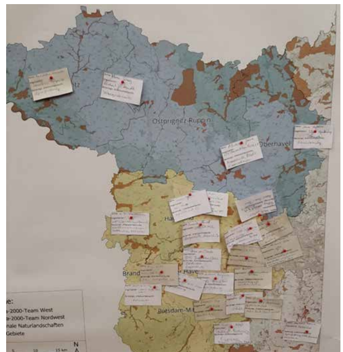
Herkunft der Teilnehmenden am Netzwerktreffen West-Nordwest-Brandenburg am 9. Oktober 2023.