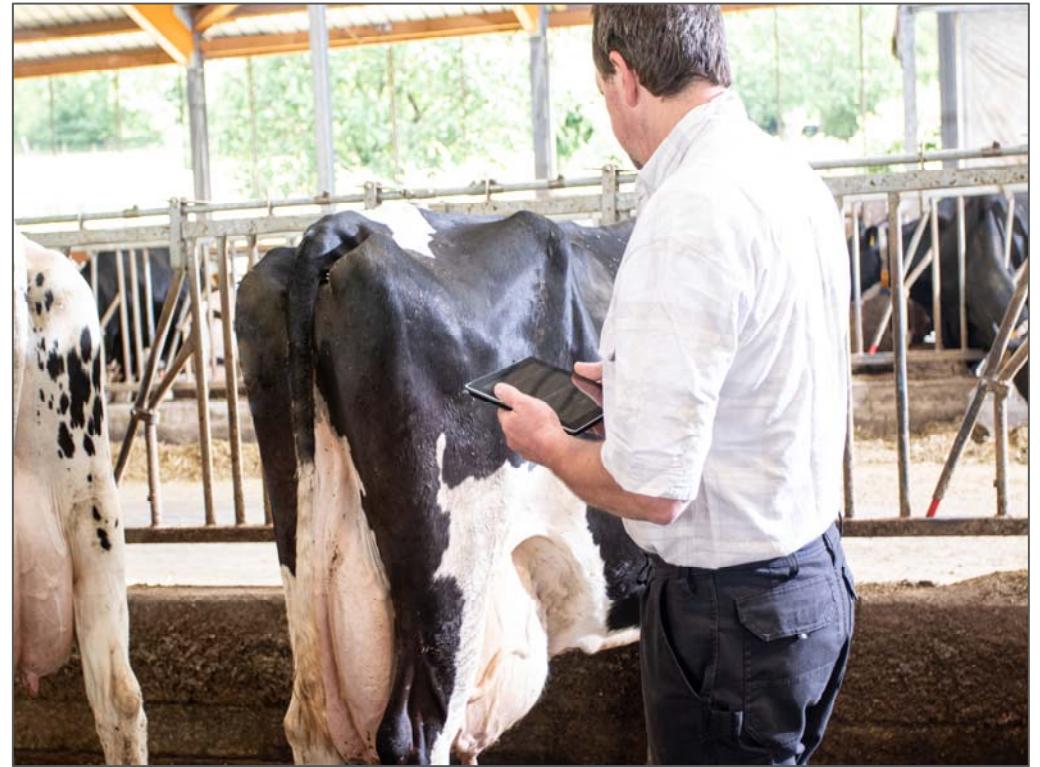
Die Erfassung von tierbezogenen Daten erfolgt praktikabel über die App direkt am Tier.

Die Erhebung und Bewertung des Tierwohls im Rahmen der betrieblichen Eigenkontrolle ist für Milchviehhalter verpflichtend. Wie ist Tierwohl überhaupt messbar und wie können die Informationen sinnvoll genutzt werden?